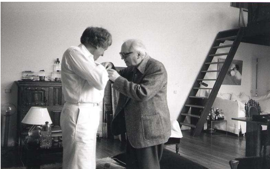
Olivier Messiaen essaie d'accrocher l'insigne de la Légion d'Honneur à la veste de Iannis Xenakis, rue Chaptal, 1977.

Mon article paraîtra en juin dans Les Nouvelles Littéraires . sous le titre : « Vous avez dit Diatope ? »