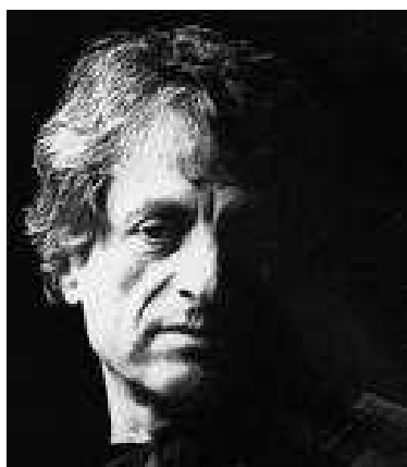
Iannis Xenakis, 1922 - 2001

Peut-on dire alors que le Diatope est une sorte de prototype de « l'œuvre-Gestalt », dont le tout serait plus que la somme des parties ? Une forme d'art qui serait en fait un voyage mental ? Ou plus simplement une nef spatiale vrombissante qui se propose de nous emmener vers cet indicible, ou, selon l'expression d'Hermann Hesse, « à la recherche d'une unité cachée de l'Univers et de l'esprit humain » ?